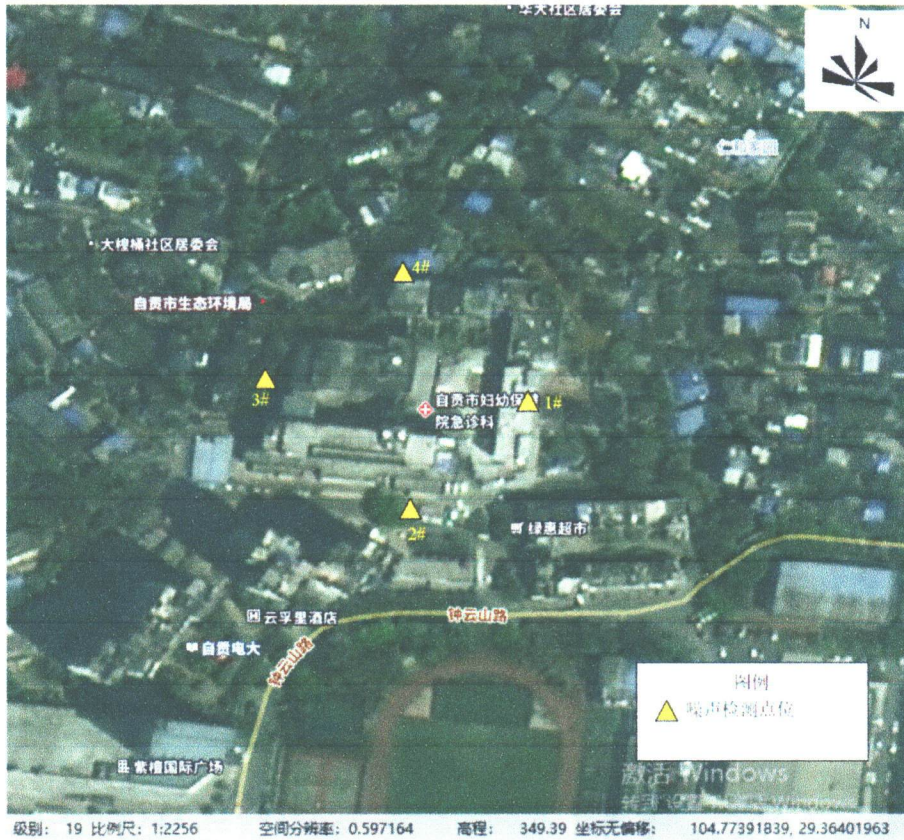
检测点位示意图 (以下空白)